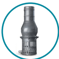
FILTRO/VALVOLA DI FONDO